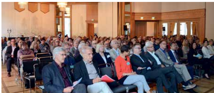
Blick ins Plenum

„Internetprogramme zur Prävention oder Behandlung psychischer Erkrankungen müssen genauso sorgfältig durchgeführt werden und genauso si-